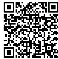
▲エントリーフォーム▲